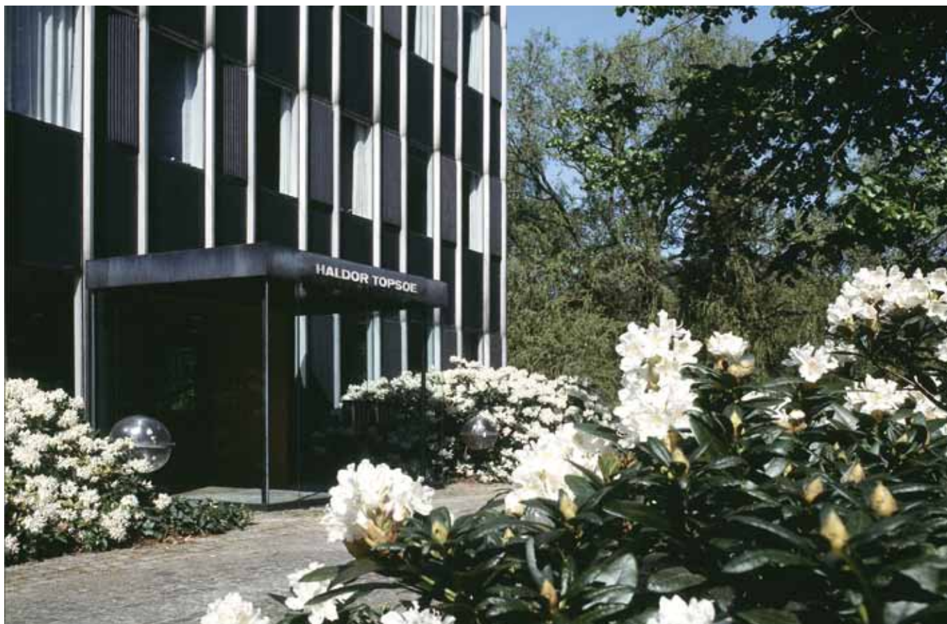
Дания, г. Люнгбю, штаб-квартира компании «Хальдор Топсе»

Группа Топсе – «Хальдор Топсе А/О» и дочерние компании – это частное предприятие, деятельность которого посвящена гетерогенному катализу. В этой области мы занимаемся научными исследованиями и разработками, производством и продажей катализаторов, а также проектированием и поставкой каталитических установок и производств.