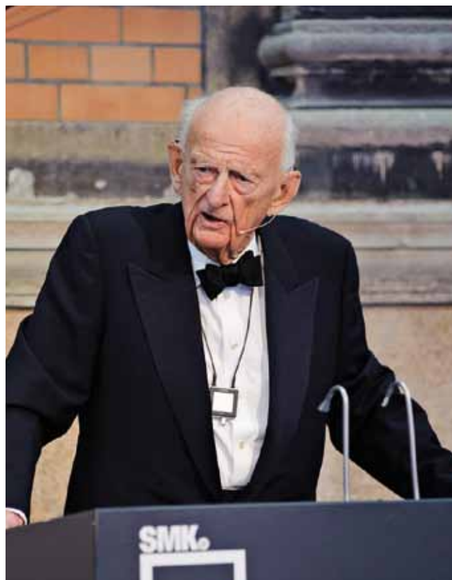
Обращение к сотрудникам «Хальдор Топсе» на праздновании юбилея компании, Копенгаген, 10 апреля 2010 г.

В будущем потребность в энергии будет только увеличиваться. Таким образом, в течение еще многих лет сохранится наша зависимость от надежных источников энергии. Мы, конечно, знаем, что запасы нефти и газа иссякают, уголь тоже закончится, но позднее. Что же тогда нам делать? Реально не знает никто. Некоторые считают, что возобновляемые источники энергии решат проблему. Я в этом сомневаюсь. Думаю, это должно быть сочетание возобновляемых ресурсов и ядерных источников энергии.